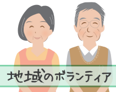
地域のボランティア