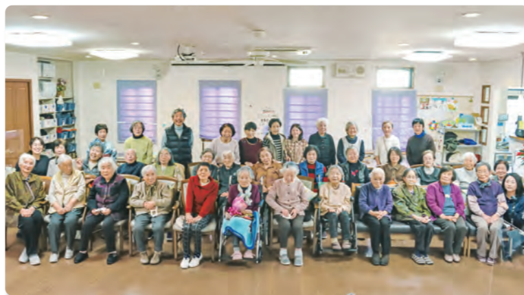
■岡山県指定通所介護施設 介護保険事業所番号: 3372200893